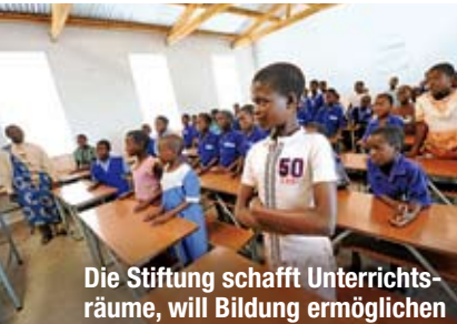
Die Stiftung schafft Unterrichtsräume, will Bildung ermöglichen