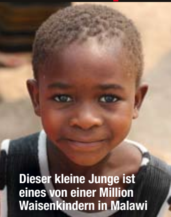
Dieser kleine Junge ist eines von einer Million Waisenkindern in Malawi