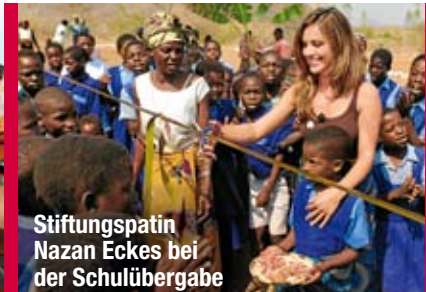
Stiftungspatin Nazan Eckes bei der Schulübergabe